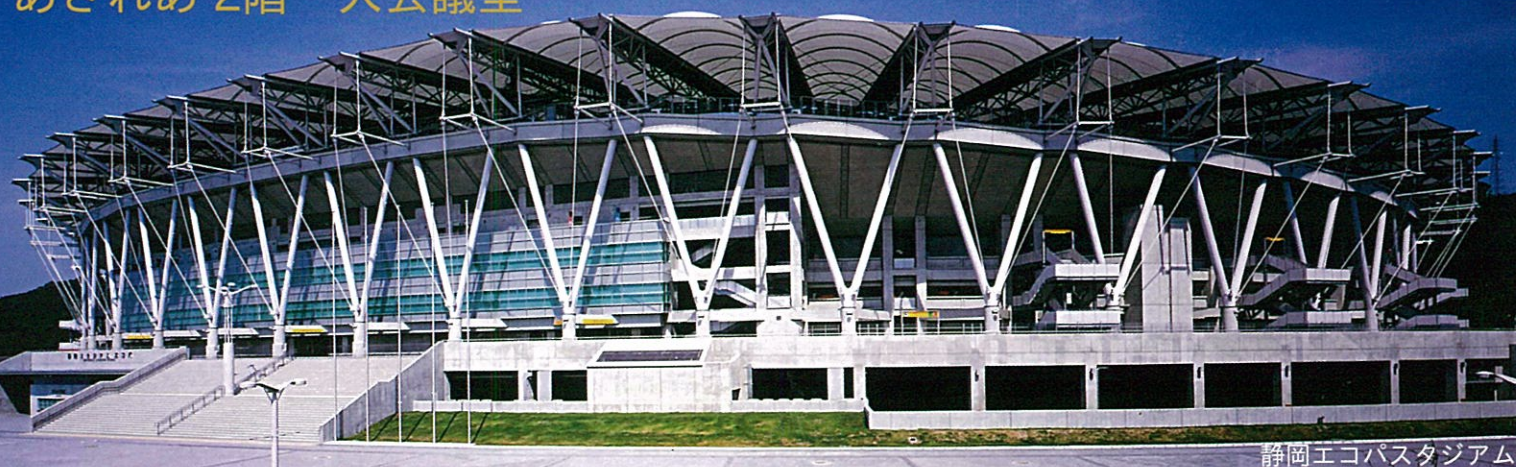
静岡エコパスタジアム

長い人類のものづくりの世界。そこには常に、2つのベクトルともいべき人間の「想像力」とその時代の「実現力」との結実が見られます。