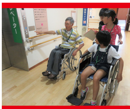
【市町社会福祉協議会を通じた福祉教育事業など】