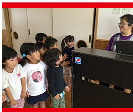
【保育園の機器整備】