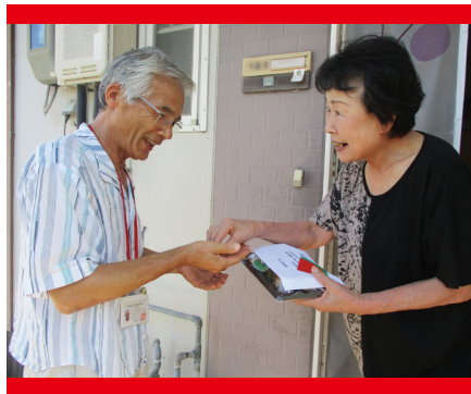
【一人暮らし高齢者見守り事業】