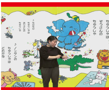
【聴覚障害児のための手話による童話DVD制作事業】