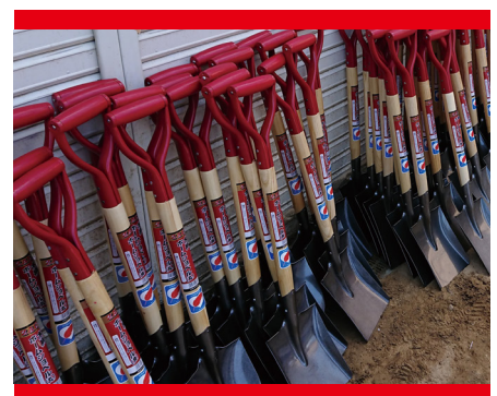
【災害ボランティア活動用資機材整備】