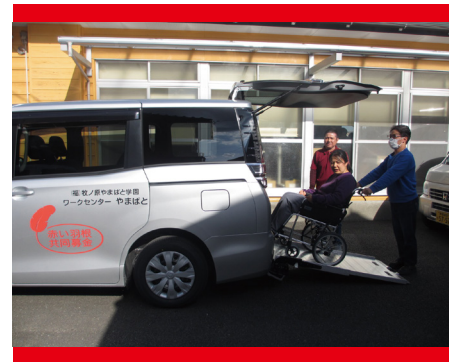
【障害者が働く作業所の機器整備】