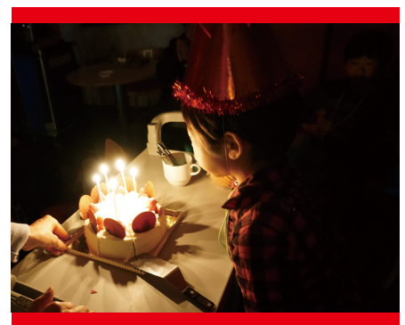
【障害者施設で作ったケーキをこども食堂の誕生日会へ】