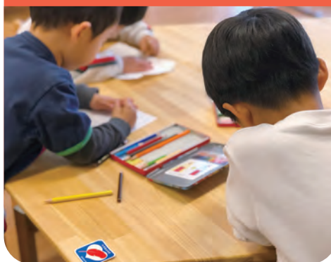
保育園のテーブル