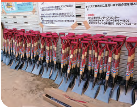
災害ボランティアの活動用資機材整備