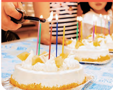
障害者施設で作ったケーキをこども食堂の誕生日会へ