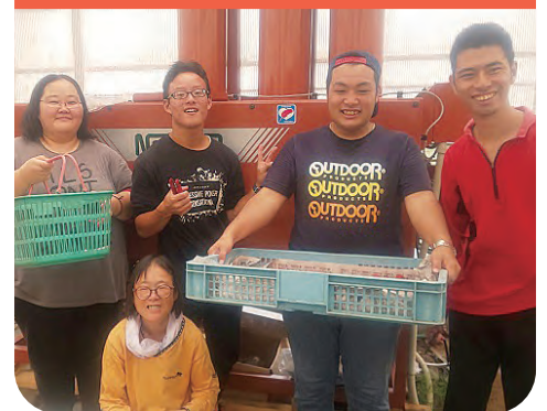
障害者が働く作業所の機器