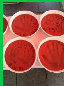
不思議なコンクリートの実演